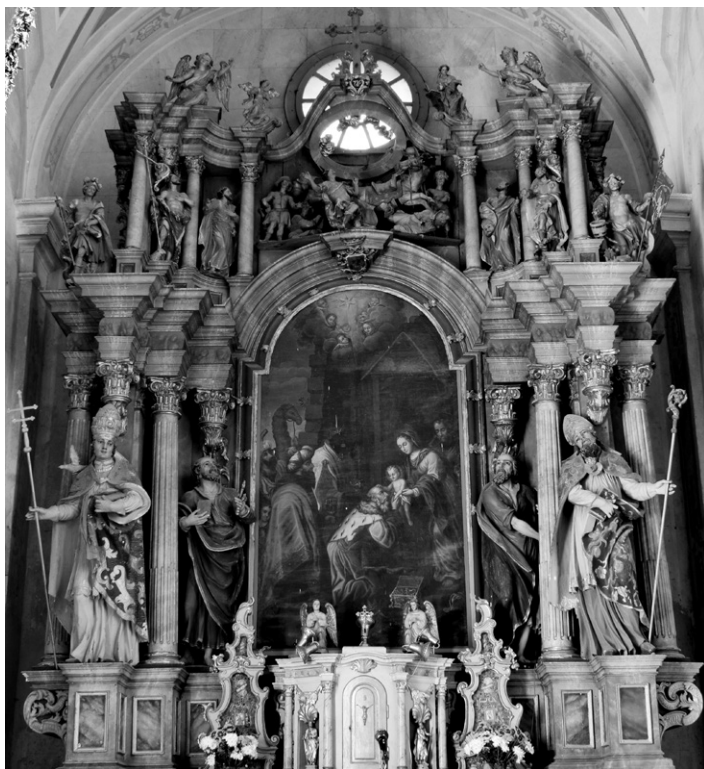
Slika 5: Veliki oltar v cerkvi sv. Treh kraljev v Studenicah.

Marije Konstance, poznejše predstojnice, je v studeniški samostan vstopila leta 1696, pri petnajstih letih, kjer je kot redovnica obdržala svoje krstno ime. 95