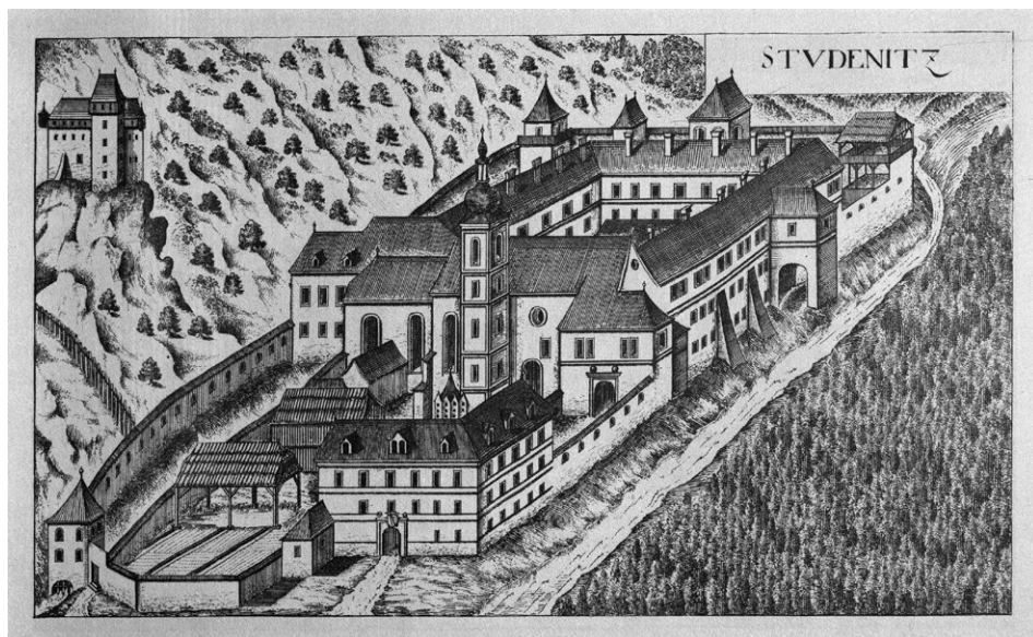
Slika 4: Vischerjeva grafika samostana Studenice.

selitev dela skupnosti pod vodstvom priorice ali katere od starejših redovnic ni pomenila oddiha, temveč ukrep za krepitev zdravja, s čimer se je strinjala tudi cerkvena oblast. 87