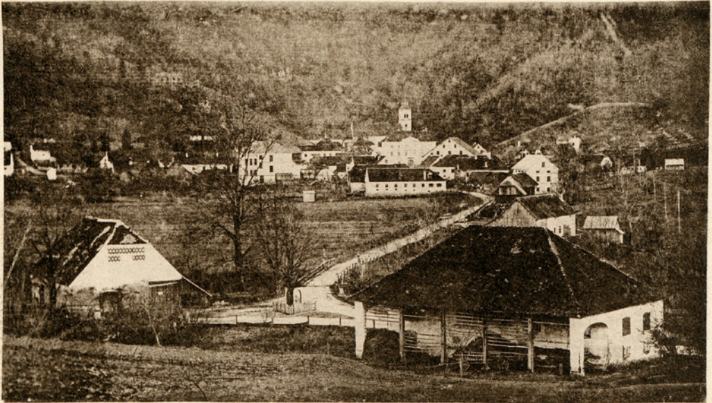
Studenice, p. Poljčane.