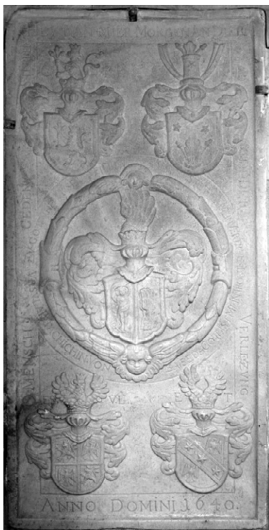
Slika 3: Nagrobnik priorice Uršule Patačić pl. Zajezda.

družine, 56 kar je bilo po redovnih konstitucijah prepovedano, česar pa očitno niso upoštevali.