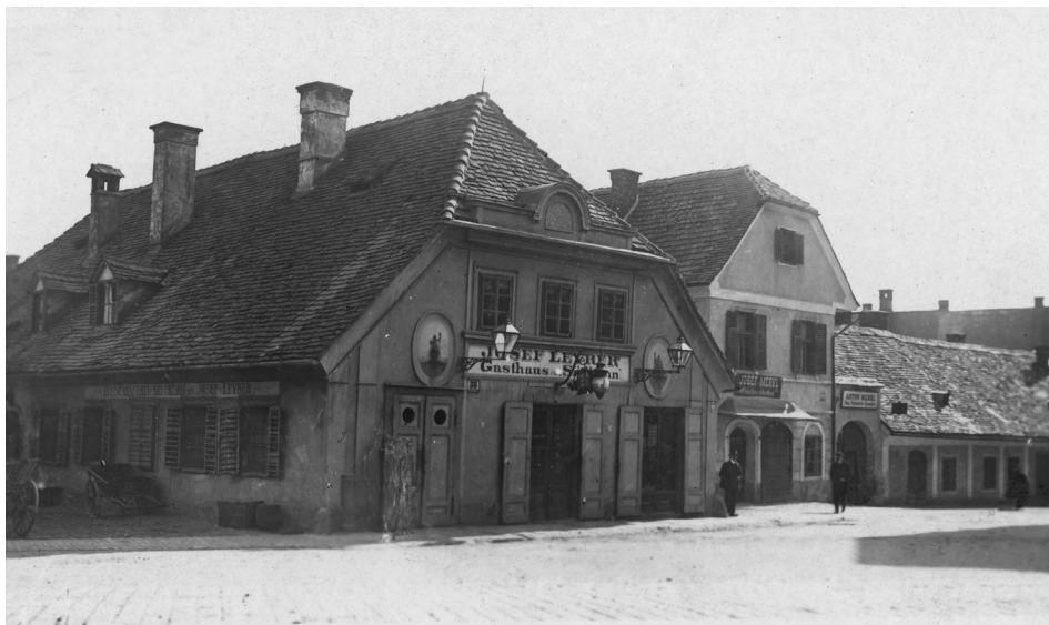
Slika 3: Nikola Tesla je v svojem mariborskem obdobju med septembrom 1878 in marcem 1879 svoj prosti čas najraje preživil v gostilni Pri južni železnici (Gasthaus zur Südbahn) ob Tegetthoffovi cesti (sedaj Partizanska cesta) s strastnim igranjem kart in biljarda.