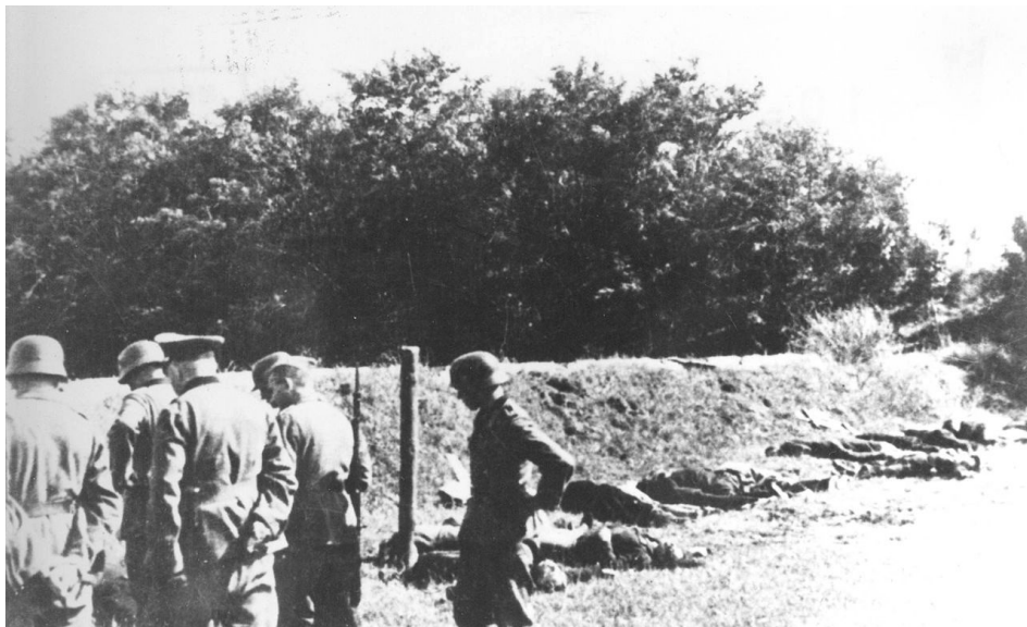
Slika 5: Streljanje taboriščnikov v Jajincih.

Romi so bili tudi žrtve partizanskih pobojev na območju Ljubljanske pokrajine. Pomor prve skupine sta izvršili dve četi Šercerjevega bataljona 10. maja 1942 v Gabrju pri Mačkovcu, ko sta bili pobiti dve skupini Romov. Prva je štela več kot deset pripadnikov, druga pa skoraj petdeset 39 . Drugi večji pomor Romov se je zgodil sredi maja 1942 v soteski Iške pri Iški vasi. Na Notranjskem so partizanske enote na osvobojenem ozemlju usmrtilе vsaj 70 Romov. Do tretjega pomora Romov je prišlo konec maja 1942 v bližini Sodražice, kjer so partizani aretirali skupino potujočih Romov med njihovo tradicionalno selitvijo iz kraja v kraj. Pripravili so proces pred partizanskim sodiščem, jih obtožili izdaje v korist italijanskih okupatorjev ter jih nato postrelili. Zadnji večji partizanski pomor Romov se je zgodil pri romskem naselju v bližini Kanižarice pri Črnomlju. Tam so partizani iz Belokranjskega odreda 19. julija 1942 pobili okoli šestdeset Romov iz omenjenega naselja. Zanimiv je pomor