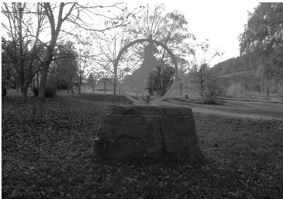
Slika 3: Spomenik sintskim žrtvam holokavsta v Begunjah.

Tudi 79 let po koncu druge svetovne vojne, v kateri je bil holokavst najhujša oblika kršenja temeljnih človekovih pravic in svoboščin brez primere, mnogi raziskovalci te tematike poudarjajo, da usoda Romov že med drugo svetovno med vojno ni bila deležna posebnega zanimanja. Zato ne preseneča, da se tudi po končani vojni leta 1945 o Romih in njihovi tragediji sploh ni hotelo nič vedeti. Za genocid nad Judi se je vedelo in se ga je začelo preučevati, genocid nad Romi in Sinti pa je bil desetletja povsem pozabljen. Tudi v Sloveniji so se raziskave o tem začele šele pred dobrima dvema desetletjema in pol.