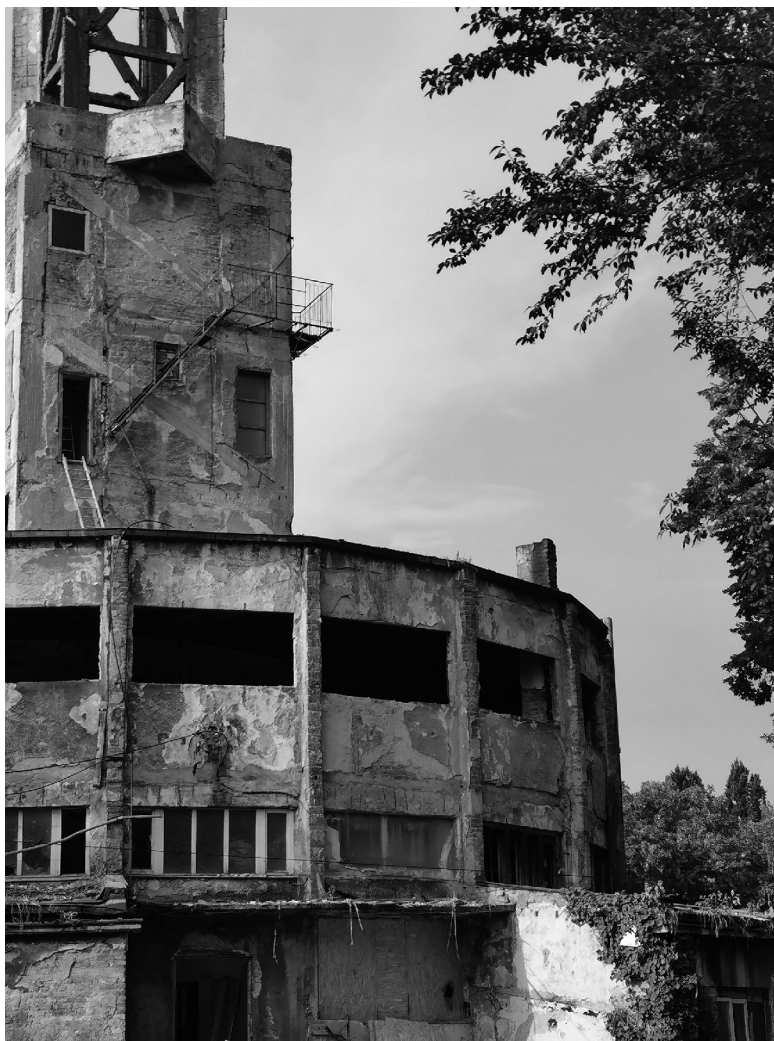
Slika 2: Ostanke taborišča Staro Sajmište, Beograd.

zaprli v taborišča. Po doslej objavljenih navedbah največ v taborišče Staro Sajmište 25 .