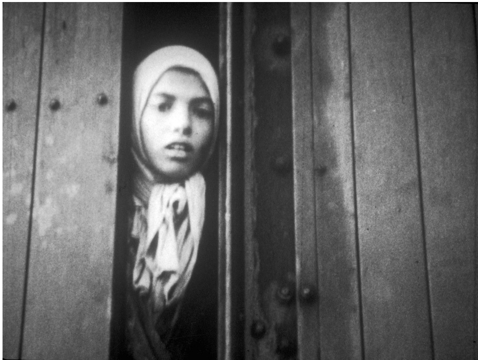
Slika 6: Sintska žena v taborišču

v soteski Iški Vintgar leta 1942. V romskem sprevodu, ki so ga partizani ponednevi gnali skozi Iško, so bile večinoma ženske in otroci. Neka ženska jim je ušla in se je zatekla v Gornji Ig. Kasneje so jo našli, tam ustrelili in zakopali 40 .