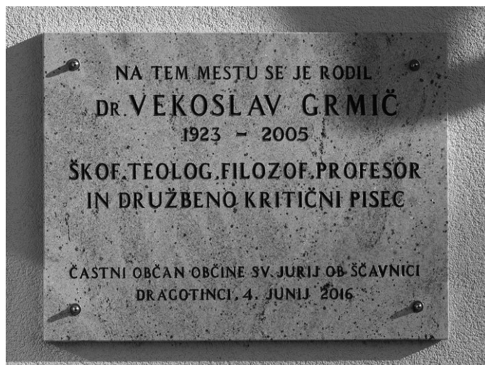
Slika 3: Spominska plošča na hiši, ki stoji na mestu rojstne hiše dr. Vekoslava Grmiča. Plošča je bila odkrita leta 2016.