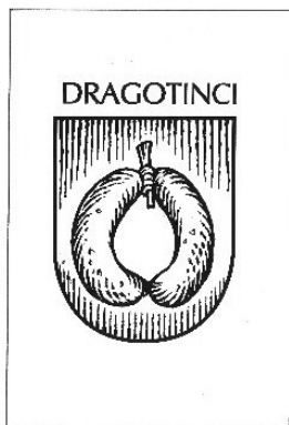
Slika 1: Šaljivi vaški grb vasi Dragotinci, klobasa. 5

Dragotinci so vas na levi strani danes regulirane struge reke Ščavnice. Vas je sestavljena iz dveh delov. Osrednji del leži na robu Ščavniške doline, del naselja pa na slemenu, ki se vzpenja proti severu v Kapelske gorice in ga domačini imenujemo Dragotinski Vrh. Z izgradnjo avtocestne povezave Maribor–Lendava leta 2008 oba dela vasi ločuje avtocesta. Prav ta dva mejnika, hidromelioracija Ščavniške doline v 80. letih preteklega stoletja in izgradnja avtoceste, sta v novejšem času najbolj zaznamovala izgled pokrajine, kjer se gričevje Slovenskih goric spušča v Ščavniško dolino, ki je usmerjena proti Murskemu polju. Leta 2020 je v Dragotincih živelo 111 prebivalcev. Starostna sestava je zelo neugodna, saj je bilo tega leta mlajših od 15 let le 13 % prebivalstva, starejšega od 65 pa več kot petina. 6